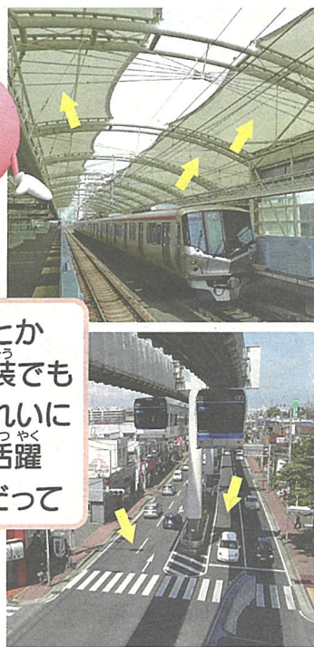
駅の屋根とか道路の舗装でも環境をきれいにするのに活躍してるんだって

そして、水中の汚染物質も分解できます。これによっていったい何ができるのでしょうか？ 次回はそれをお話します。