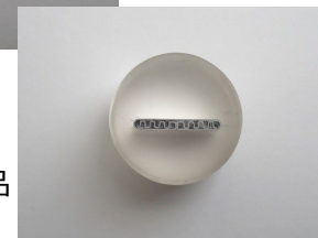
形状観察のために加工された熱交換器部品