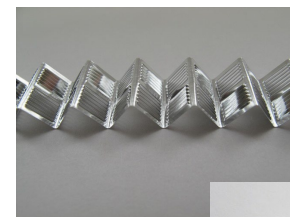
変形させた熱交換器部品

熱交換器用のアルミ部品は複雑な形状をしており、それまでの形状観察は変形させて顕微鏡で斜め上から見たり、樹脂で固めてから切断した面を観察するしかなく、非破壊での観察方法が求められていた。