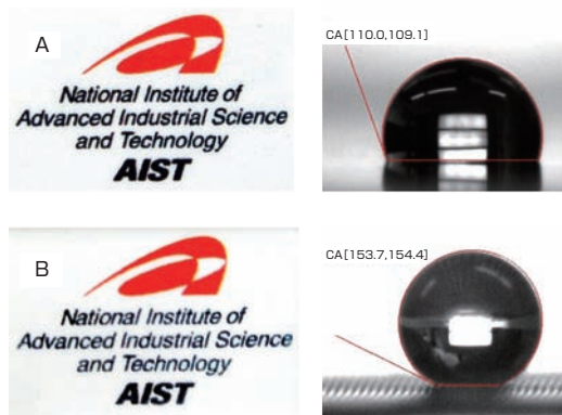
図2 A：AISTの文字上に置いた薄い透明なフッ素樹脂膜の熱転写前の写真と水の表面接触角 ( 110^\circ ) B：熱転写後の写真と水の表面接触角 ( 154^\circ )