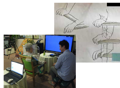
観察とインタビュー