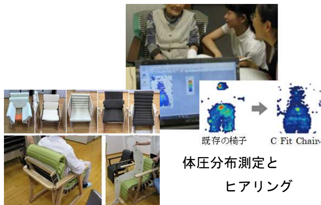
プロトタイプによる検証

木製のフレームは、利用者のニーズや施設のイメージに合わせられるよう、安定感のあるトライアングルフレームとスッキリとまとまったキュービックフレームの2種と樹種を組み合わせて選ぶことができます。