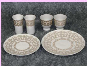
新しい薩摩焼デザイン