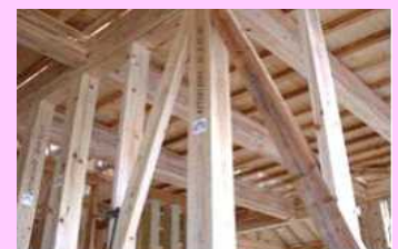
認証かごしま材(木材乾燥)