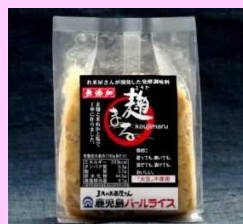
肌ヌカみその開発と商品展開