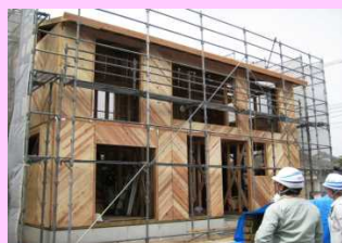
県産材によるスギ板パネル