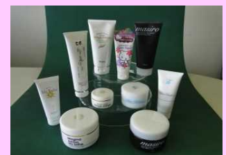
シラス入り洗顔料