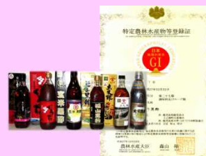
『鹿児島の壺造り黒酢』のGIマーク取得