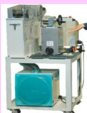
超重量円筒部品の簡易面取り装置