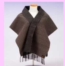
綾緋カシミヤストール