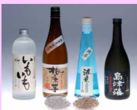
全量いも仕込み焼酎