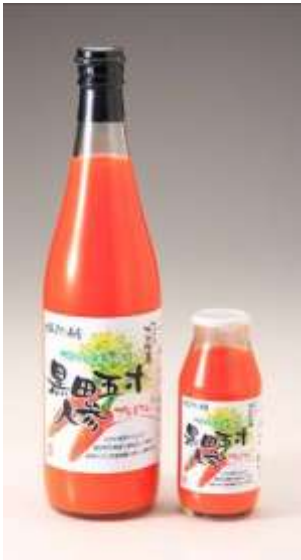
乳酸発酵人参ジュース 「黒田五寸人参プレミアム」

長崎県大村市特産の黒田五寸人参をジュースにし、植物性乳酸菌 Lactobacillus plantarum SK-40 で乳酸発酵させた飲料。糖類を加えることなく、人参ジュースだけで発酵。乳酸発酵により pH を低下させ、クエン酸無添加でも日持ちが向上。味も自然な甘みとまろやかな酸味になり、子供やお年寄りにも飲みやすい商品となった。甘味成分のアラニン、旨味成分のグルタミン酸、更にストレスを抑制する \gamma -アミノ酪酸 (GABA) を従来品と比較して約 2 倍量含む。コップ 1 杯 (200ml) あたり 2,000 億個の乳酸菌 (殺菌) が入っている。