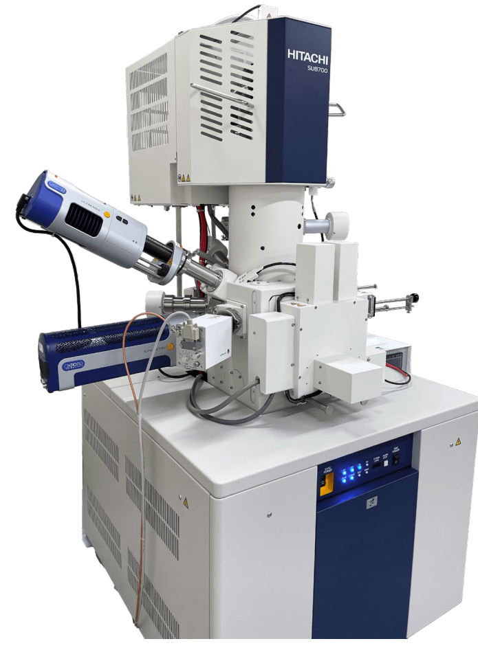
電界放出形 走査電子顕微鏡