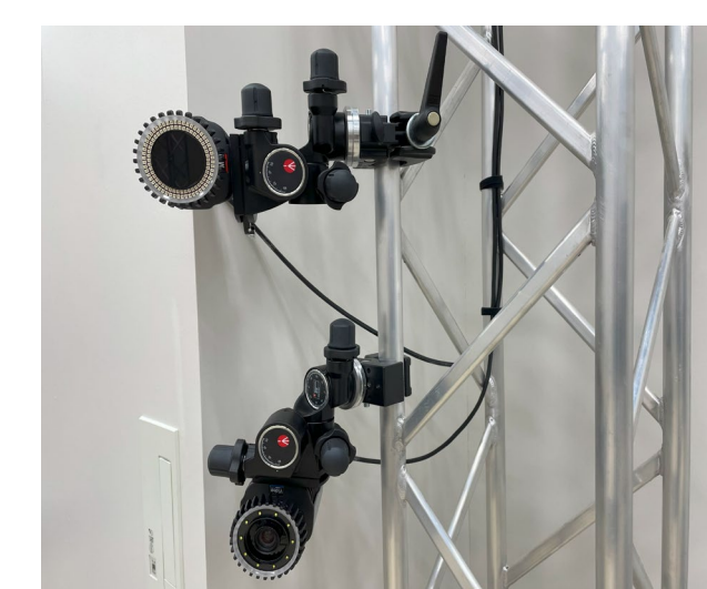
光学式モーション キャプチャ