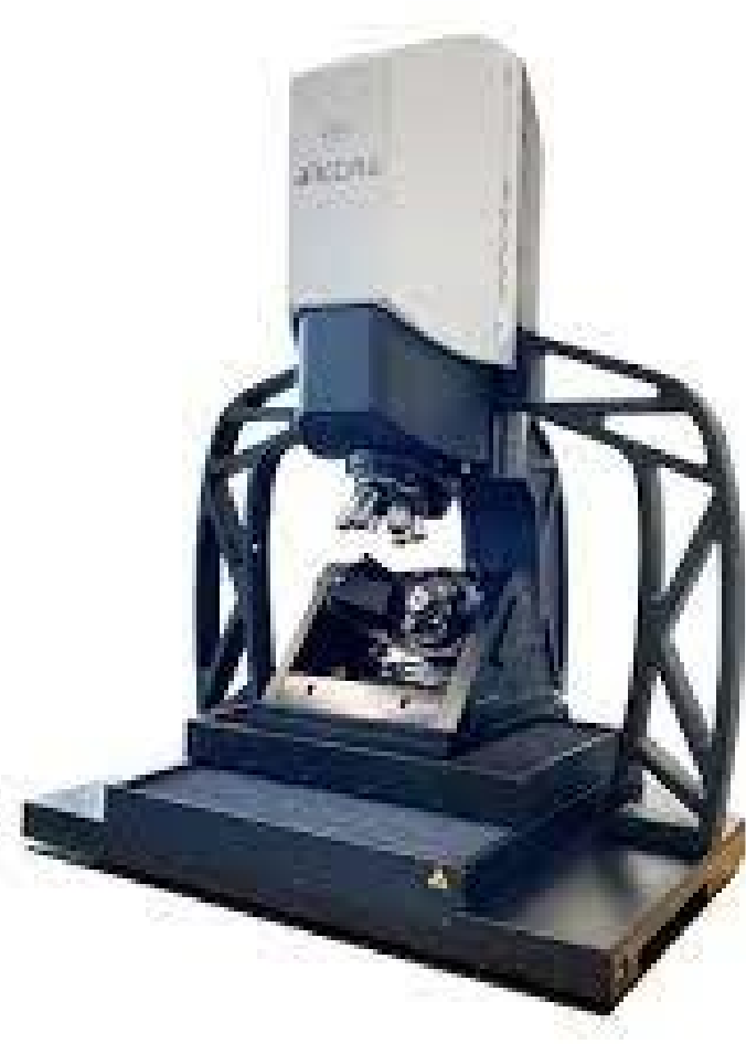
非接触3次元 形状計測器