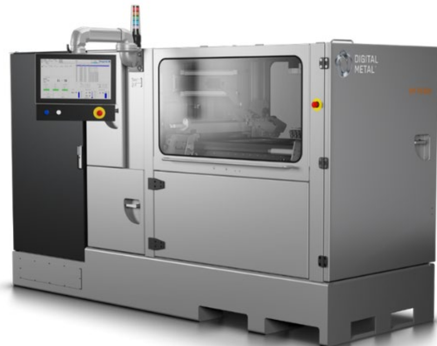
バインダージェット式金属3Dプリンタ