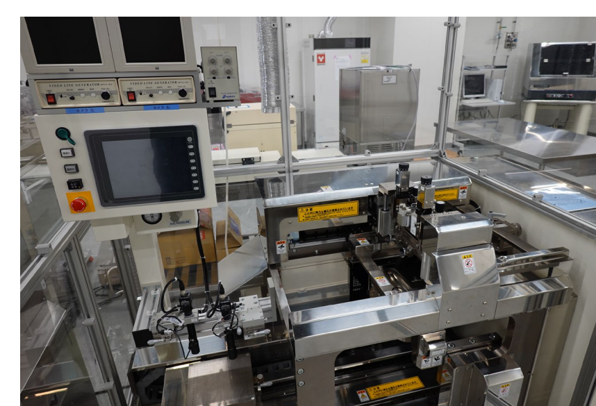
スクリーンオフセット 印刷装置