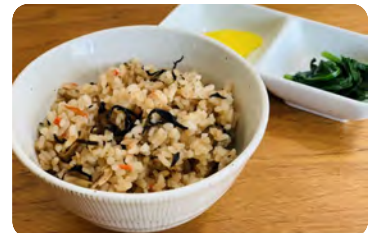
生活習慣病に有効である可能性あり